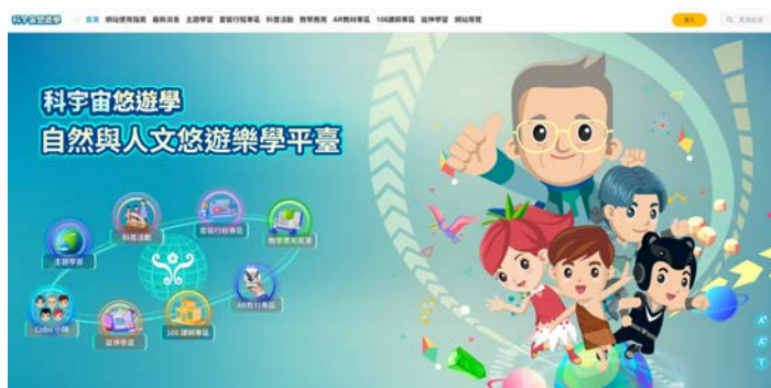
▲「科宇宙悠遊學」自然與人文悠遊樂學平臺

本平臺以既有數位學習資源為基礎，整合自然科學與人文領域內容，並串聯教育部因材網，提供教師於課堂教學與校外學習中運用之數位教材。透過線上學習資源與實體場域之結合，發展跨虛實之自主探索學習模式，引導學生進行觀察、探究與統整跨學科知識，拓展多元學習視野，提升學習深度與應用能力。