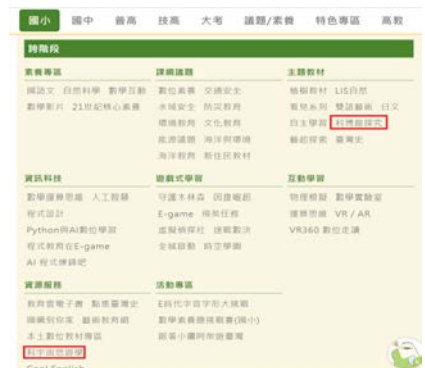
▲因材網—科博館探究