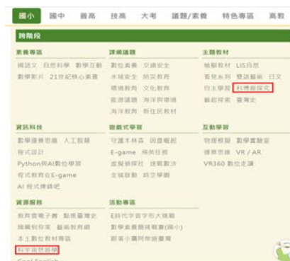
▲因材網—科博館探究