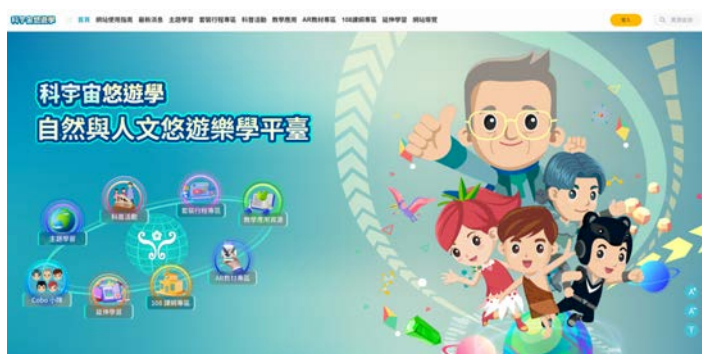
▲「科宇宙悠遊學」自然與人文悠遊樂學平臺

本平臺以既有數位學習資源為基礎，整合自然科學與人文領域內容，並串聯教育部因材網，提供教師於課堂教學與校外學習中運用之數位教材。透過線上學習資源與實體場域之結合，發展跨虛實之自主探索學習模式，引導學生進行觀察、探究與統整跨學科知識，拓展多元學習視野，提升學習深度與應用能力。